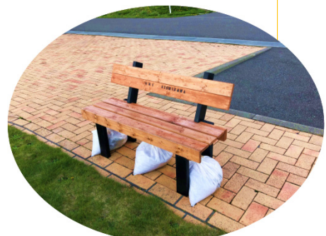
河川公園の景色を一望できる 思いでベンチ

天塩川はダムや堰堤など川を遮る工 作物の無い区間が日本一長く、豊 かで多様性のある生態系が残されて います。絶滅危惧種である野鳥「オ シロワシ」や「オオヒシクイ」を観るこ とができます。また、釣り人から人気 の高い幻の魚「イトウ」の生息数が 最も多い河川としても有名です。