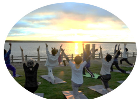
夕日を眺めながら 自然の中でヨガ体験！