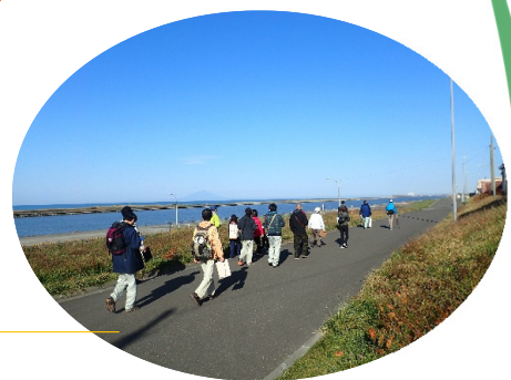
天塩川沿いをのんびり ウォーキングにも最適