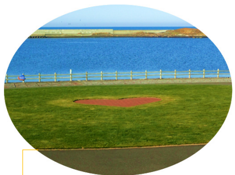
真上から見ると可愛いハートの形 待ち合わせ場所におすすめ