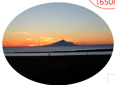
美しい夕暮れの利尻富士が見られる 天塩の人気スポット