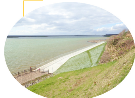
綺麗に整備されたフットパス 間近に天塩川が見られます！