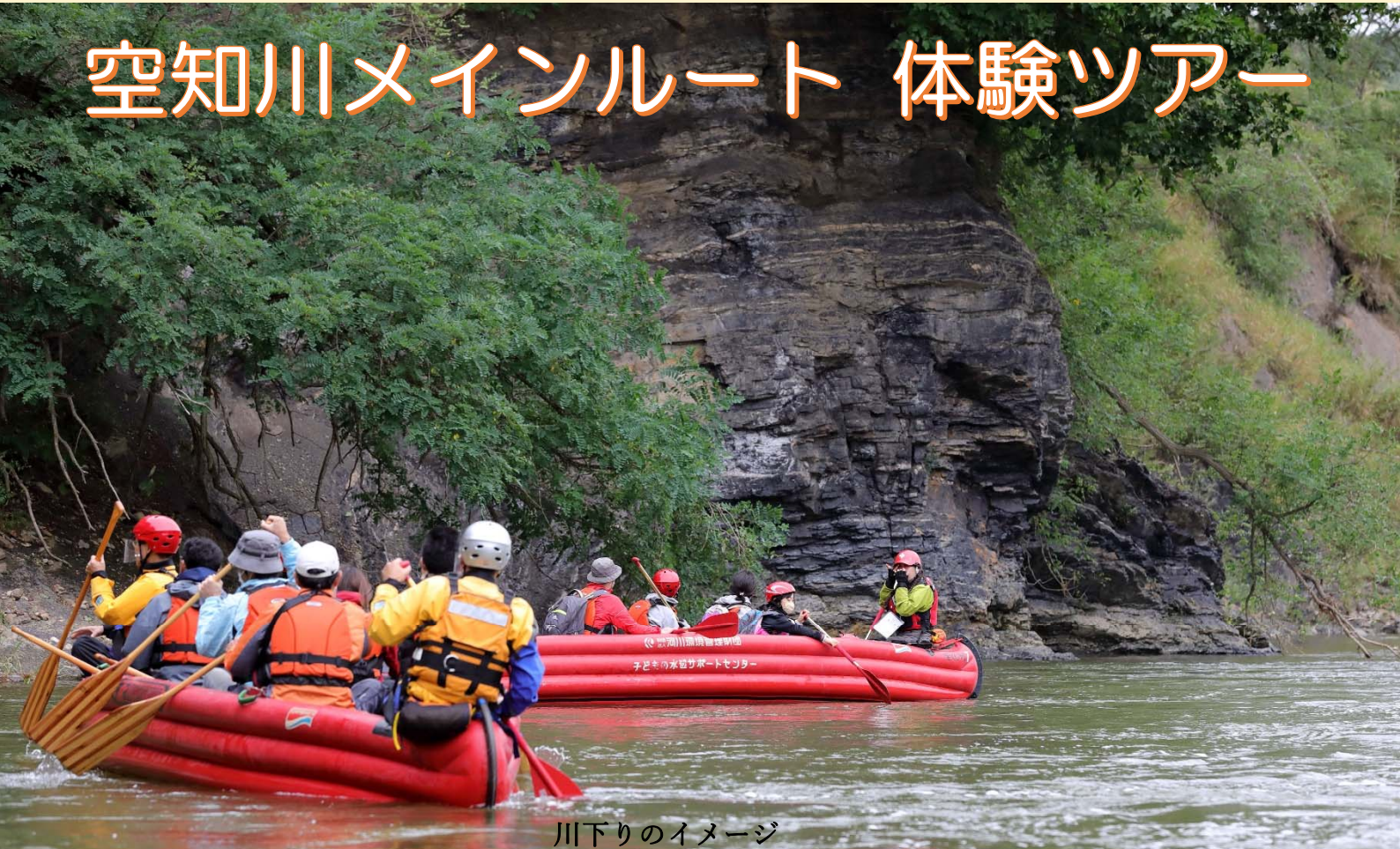
川下りのイメージ