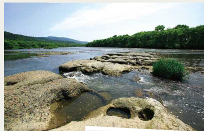
美深町 恩根内テッシ 天塩川の源流となったテッシ (アイヌ語で梁の意味)

当時の天塩川流域を探索した記録である「天塩日誌」を振り返りながら、現在の川の流れに重ねあわせると、新たな天塩川の流れが見られることでしょう。