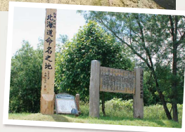
音威子府村 北海道命名之地