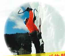
アイスクライミング体験