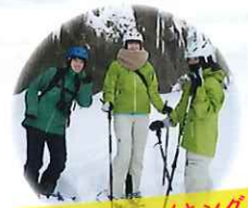
スノーシューハイキング