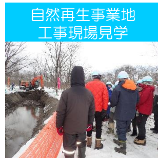
自然再生事業地 工事現場見学