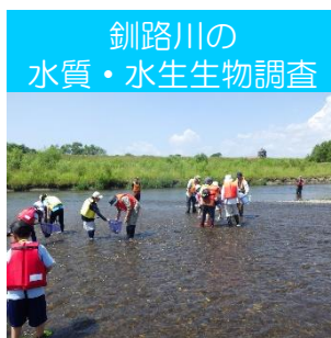
釧路川の 水質・水生生物調査