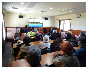
湿原についての 勉強会