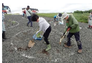
「花咲かしいさんプロジェクト」での植樹

釧路湿原や河川環境などについて、より理解を深めることを目的に、希望者を対象とした植樹体験や現場見学などの学習会を、年4回程度開催いたします。