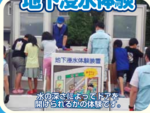
水の深さによってドアを 開けられるかの体験です。