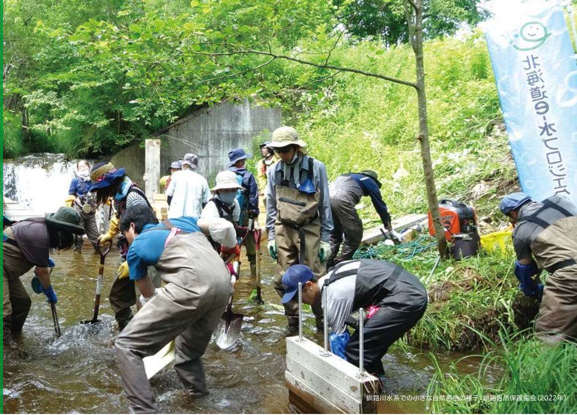
釧路川水系での小さな自然再生の様子。釧路自然保護協会(2022年)