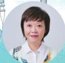
アンバサダー 増田 明美さん (スポーツジャーナリスト)