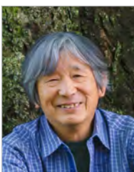
SEA TO SUMMIT® 連絡協議会理事長 モンベルグループ代表

選手の皆様には万全の体調の下、事故には十分注意されご健闘くださるとともに、大会に関係されます皆様のご健勝とご活躍をお祈りいたします。