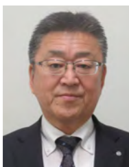
オホーツク SEA TO SUMMIT® 実行委員長 小清水町長

「SEA TO SUMMIT®」は人力だけで海から頂上を目指し、大自然を全身で感じながら汗をかき、人と自然のかかわり方の在るべき姿を改めて考える大会です。そんな時間を皆さんと共有したいと思います。