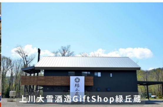
上川大雪酒造GiftShop緑丘蔵