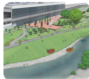
旭川市・旭川駅周辺かわまちづくり計画（令和5年8月）より