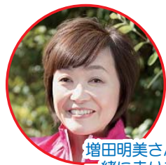
増田明美さんが一緒に走ります